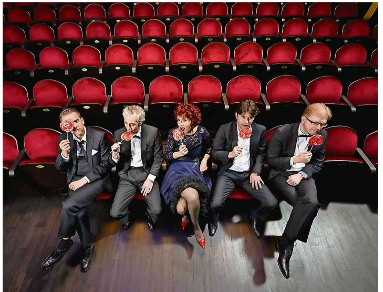
fe-mail & Band präsentieren ihr neues Album kurzweilig und vor allem bunt wie ein Lollipop.