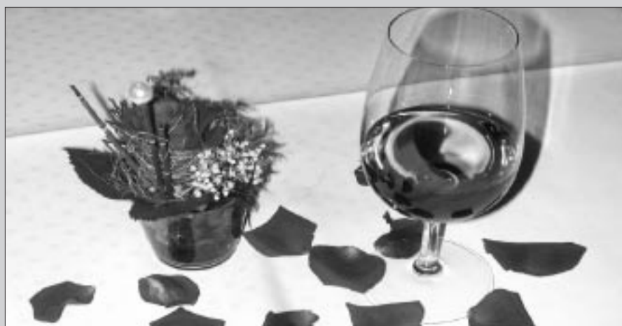
Herzschermerz und romantische Atmosphäre im Landgasthof Löwen Heimiswil.